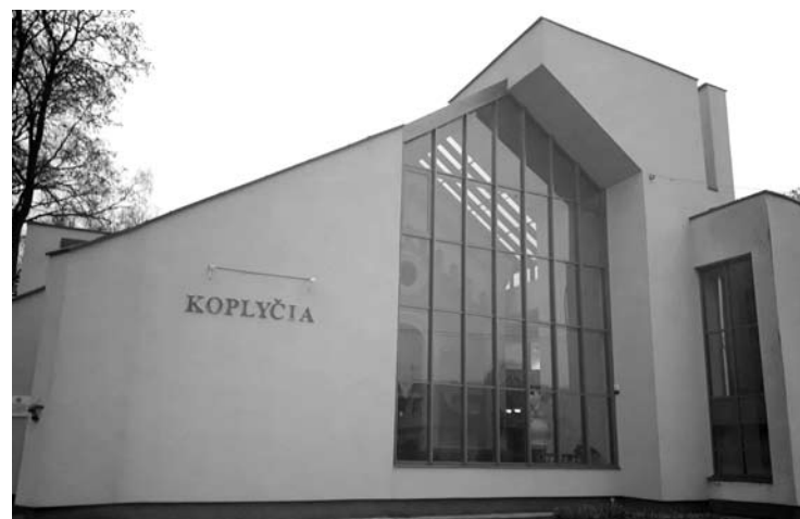
Anot projektuotojų, nors Anykščių koplyčios teritorija turi istorinę vertę, daug išpūdingų medžių, jos būklė nebeatitinka dabartinių poreikių.

„Trinkelė užtenka tik prie koplyčios įėjimo ir take aplink ją, o medžiai įkalinti jose – baisu! Ir tvora norima užtvirti – kam to reikia?“, - komentaruose klausė