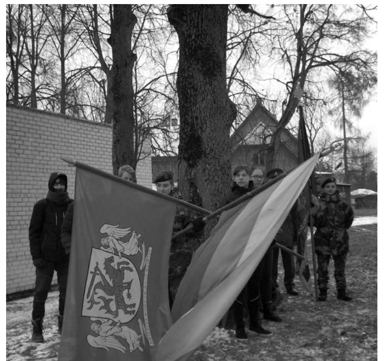
Po Vilniaus ažuolu...

nai, dešinėje jau Pagojės ežeriukas, ant jo ledo juoduliuojantys žvejai, jų gal visos dešimtys... Išėjome į plentą ir kiek žengtelėję stabtelėjome istorinės atminties valandėlei prie paminklo 1944 m. vasarą su sovietų kariuomene besikovusiems lietuvių šauliams. Elegantiškas, dailus akmuo. Palei ežerą, priimant kai kurių automobiliais pro mus pralekiančių pasveikinimus. Linksmai plazdanti, iš rankų į rankas perduodama Aukštaitijos vėliava. Jau Sindiko gyvenimas, jau Gojaus kalnas, jau Vikonių kaimo vaizdai, jau Juškų šiltnamiai ir žygiuojančių šauliukų lūpose skambanti lietuviška daina. Vis artėjantys ir didėjančios aukščiausios bažnyčios bokštai, kryžkelė, išsiskyrimai ir atsisveikinimai, pasilikusių žygis į slėnį, į Anykščių miestą, į jo svarbiausią aikštę su Laisvės skulptūra, ten, kur ir prasidėjo mūsų žygis Troškūnų šauliams ir visiems Lietuvos kariais atminti.