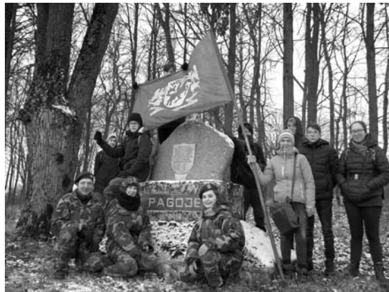
Prie paminklinio akmenų, lietuvių šaulių kautynėms su sovietų kariuomene 1944 m. liepos mėnesį atminti.