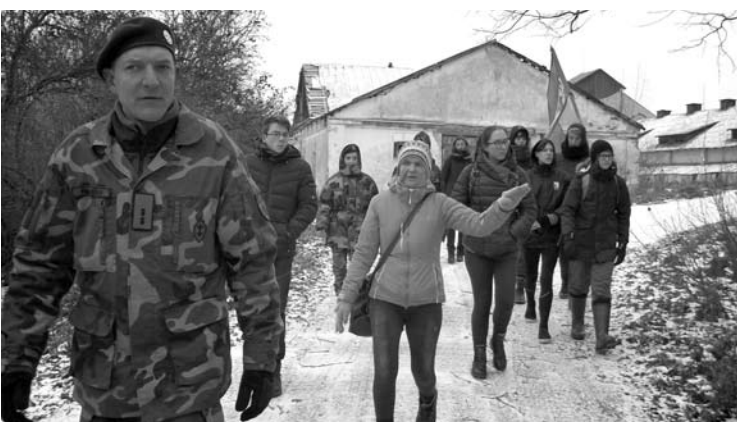
Žengiame palei buvusią spirito varyklą Montvilos dvare.

Tik pažvelki, Mama, mes seniai užaugom Ir išskridom paukščiais iš Tavų namų. Tiktai Tu, mieloji, gimtą lizdą saugai, Kad sugrįžt galėtum, kai mums neramu. Tau atrodo vakar dar maži bėgiojom, Tu glaudei kiekvieną prie savos širdies. Šiandien Tau gėlių mes puokštę dovanojam Ir ilgiausių metų norim palinkėt.